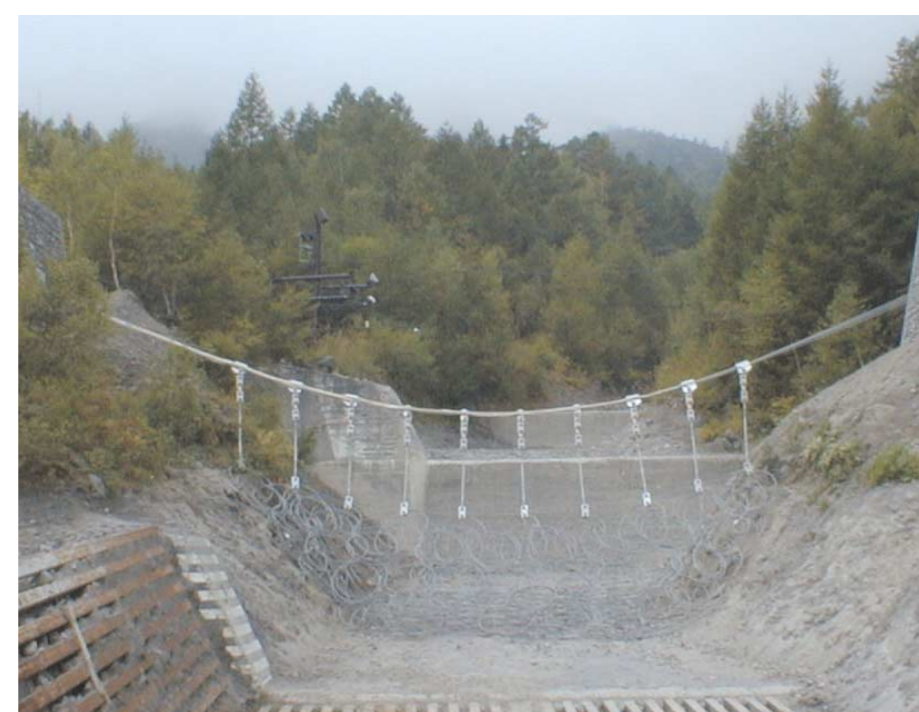
焼岳上々堀沢(長野県松本市安曇)