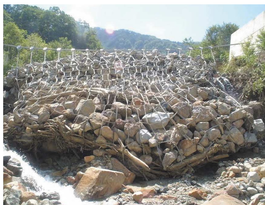
立山カルデラ多枝原谷(富山県立山町)