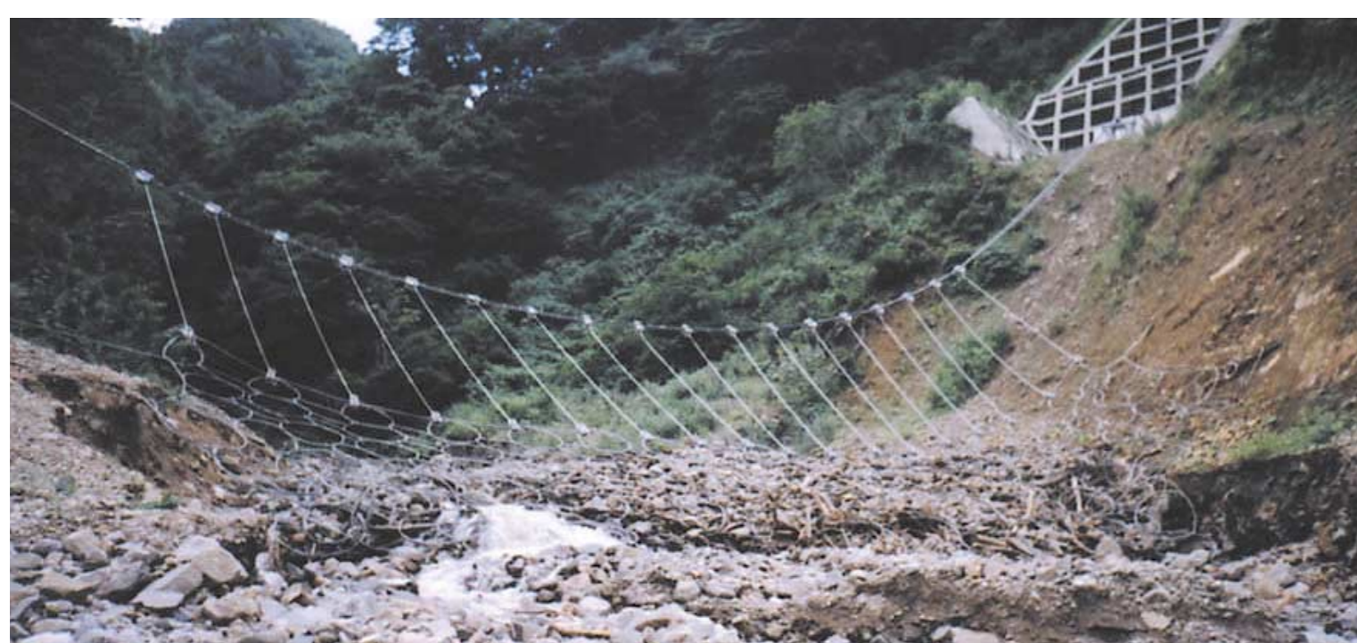
姫川濁沢(長野県小谷村)