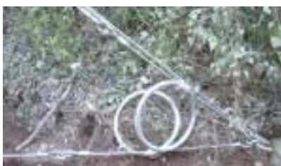
リプレースロープ