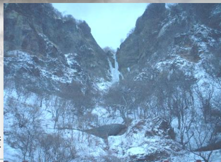
落石寸法 1.2×1.2×0.8 落石質量 約3t