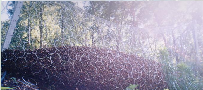
土砂捕捉状況(6号台風)