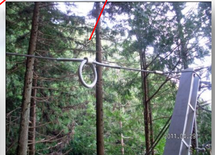
ブレーキリングが効果的に機能している